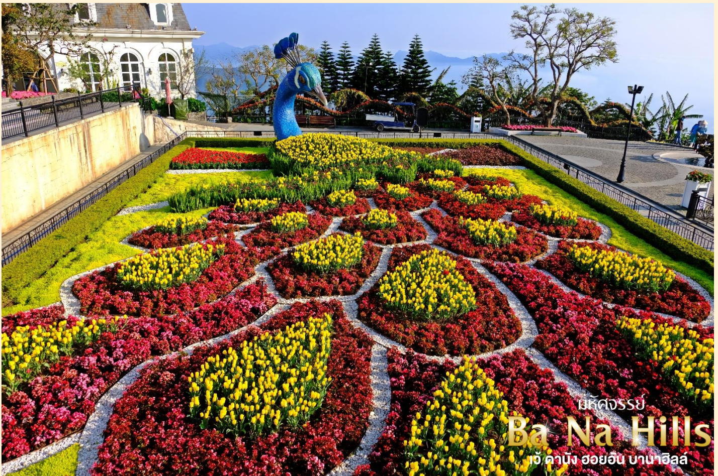
เม็คคองสรย์ Ba Na Hills เว้ คานัง ฮอยอัน บานาฮิลล์

ชมเมืองฝรั่งเศส เป็นตึกออกแบบมาได้บรรยากาศยุโรปแท้ๆแต่มาเจอได้ใกล้ๆเพียงแค่วิทยา ลัดเลาะไปตามตรอกซอกซอย มีมุมถ่ายรูปเชิคอินสวยๆหลายนมุม Le Jardin d' Amour เป็นสวนสวยสไตล์ฝรั่งเศส ที่มีทั้งดอกไม้ต้นไม้ มีมุมถ่ายรูปสวยๆ เต็มไปหมด รวมไปถึงมี โรงไวน์ Debay Wine Cellar อีกด้วยค่ะ เราเดินไปเที่ยวด้านในจะเป็นคล้ายๆ อุโมงค์ใต้ดินไวน์บ่มไวน์ เป็นทางยาว เดินทะลุชมไปเรื่อยๆ ก็จะออกมาที่สวน นอกจากนี้ เดินไปไม่กี่ไกลยังมีพระพุทธรูปองค์ใหญ่สีขาวสูงถึง 27 เมตรอีกด้วย ให้ท่านเพลิดเพลินไปกับบานาฮิลล์ โซนใหม่ Eclipse Square ตามอัธยาศัย