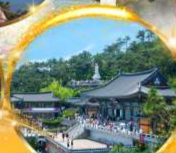
วัดแสดงยงกุงซา