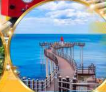
สะพานอิการ์