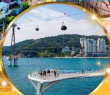
ชงโด Sky Walk